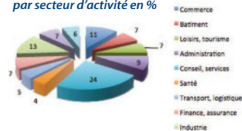
Répartition des lecteurs par secteur d'activité en %

Influence RH présente des informations, des offres claires, des chiffres simples, une veille sur les actualités du secteur afin que les responsables RH puissent bénéficier d'un véritable outil d'aide à la décision pour chacune des facettes de leur métier.